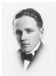
En Lima, 1915

De Larriava destacó que, a pesar de no comprender la independencia, su liberalismo le condujo «a capitular ante la realidad, como los generales de España capitularían años más tarde en Ayacucho». De Unanue resaltó que, a pesar de que «la idea separatista y democrática se halló muy alejada de sus preocupaciones», el médico-político, al sumarse a los proyectos sanmartiniano y bolivariano, mantuvo indistintamente su empeño iniciado en el Mercurio Peruano de fomentar el amor por el país. De Vidaurre ensalzó que, debido a su destierro en Estados Unidos, «en la tierra clásica de la democracia aprende lecciones de libertad» que pronto iban a nutrir sus utopías jurídicas una vez establecido en el Perú independizado. Por último, del presbítero arequipeño Mariano José de Arce encomió que «un apostolado democrático no puede ejercerse impunemente, sin el bau-