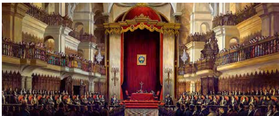
Anónimo. Primer Congreso Constituyente, 1822. Óleo, Lima

Sin embargo, fue en el extenso estudio «José Faustino Sánchez Carrión, tribuno de la República» en donde Porras desarrolló, con la convicción que deriva de la madurez intelectual, el enlace entre liberalismo, republicanism, civilidad y democracia. No fue casual que el mismo tuviese su origen en un discurso pronunciado en el Centro de Estudios Histórico Militares en 1953. Porras, en su deseo de reconciliar lo civil y lo militar, señaló al iniciar dicha alocución que «en ninguna época fue más fecunda la alianza de la pluma y de la espada que en el tiempo heroico de la emancipación». Otro aspecto que le preocupó dejar esclarecido desde un principio fue su distanciamiento con lo que denominó metodología histórica conservadora de la emancipación, que no solo omitió «la impronta de libertad de la época, [sino que] pagó tributo a la concepción aristocrática o individualista de la historia y al culto cesarista de los caudillos». Con este reclamo hizo pública la necesidad